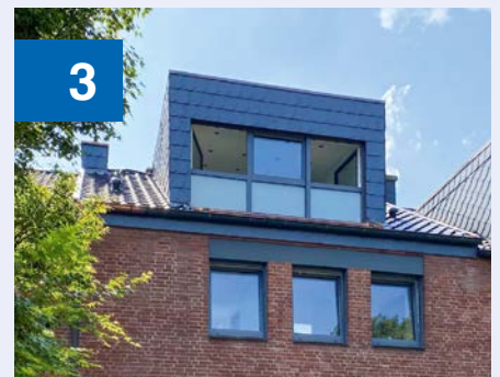
An einem Tag montiert und eingedichtet – das sorgt für kurze Arbeits- und Maschinenzeiten.