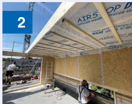
Die Elemente werden gedämmt geliefert. Auf Wunsch übernimmt Kleinwechter & Bröker auch die Trockenbau-Verkleidung.